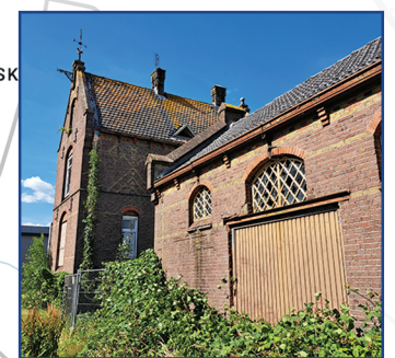
Gemeentelijk monument STATIONSGBOUW Spoorlaan 4 3931 GB Woudenberg