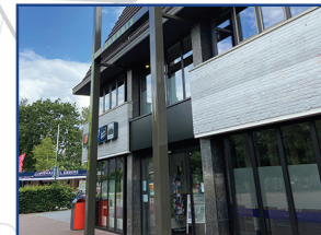
CULTUURHUIS Dorpsstraat 40 3931 EH Woudenberg