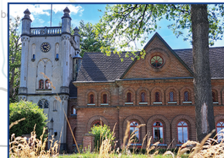
Rijksmonument KLEIN GEERESTEIN Geeresteinselaan 67 3931 JB Woudenberg